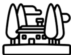
Resorts, Hóteis e Moradias