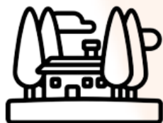
Resorts, Hóteis e Moradias